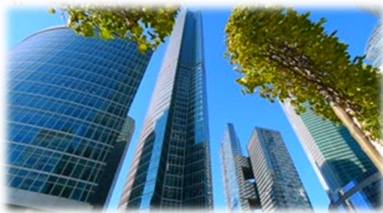
Fig. 1- Rascacielos y centro de negocios

Mediante un análisis orientado a la identificación y clasificación de los riesgos y amenazas estos sectores económicos determinan los Planes de Emergencia Internos y Externos (PEI, PEE) cuyos manuales contienen toda la información necesaria para el control de cada tipo de emergencia dentro de la instalación pública y centros de negocios que puedan verse afectadas.