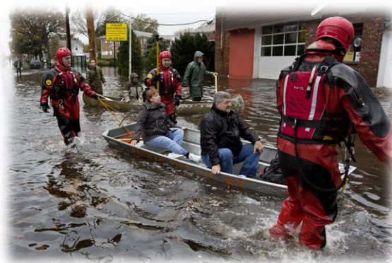
Fig. 1- Ayuda de evacuación del equipo de respuesta

Mediante un análisis orientado a la identificación y clasificación de los riesgos y amenazas estos sectores determinan los Planes de Emergencia Internos y Externos (PEI, PEE) cuyos manuales contienen toda la información necesaria para el control de cada tipo de emergencia dentro de la zonas públicas y zonas gubernamentales que puedan verse afectadas.