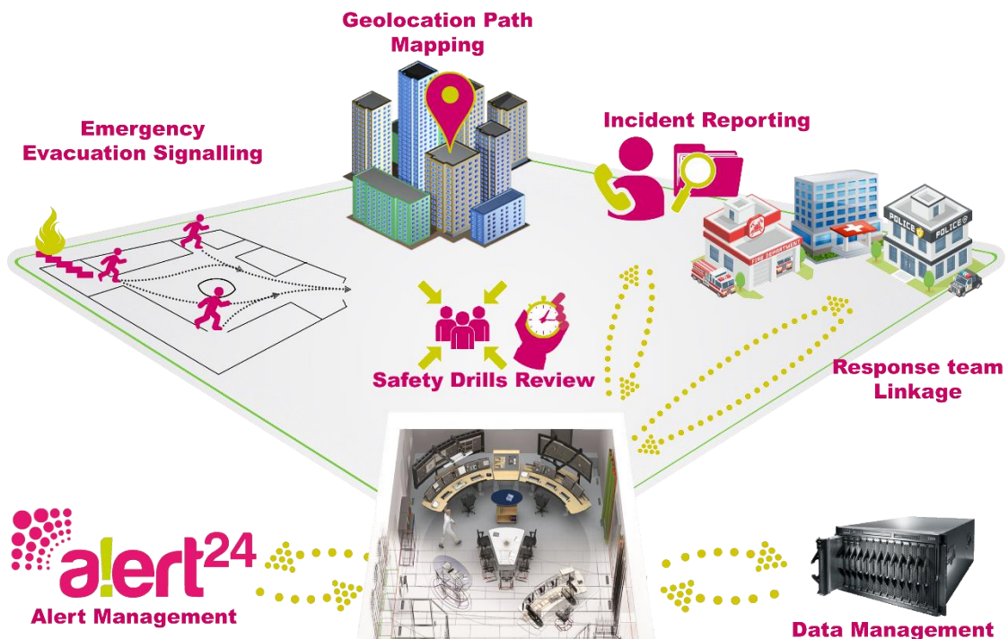
Fig. 2- Integración de ALERT24 en el sector empresarial

Para cada sector existen variedad peligros que pueden amenazar con la seguridad de las personas y la continuidad del negocio, pero todas son especialmente sensibles a desastres naturales que amenazan de manera inmediata el bienestar y la seguridad de las personas, también hay que notar que emergencias como, incendios, amenazas terroristas, falla de servicios y cualquier emergencia que amenace con la seguridad del público en general, suelen causar pánico colectivo, dificultando la comunicación de los planes previamente establecidos, diseñados para la protección y guía del público afectado; Es por ello que la comunicación rápida y efectiva con el equipo adecuado para atender a la situación es esencial y crítica para la implementación efectiva de cualquier plan de seguridad y emergencia.