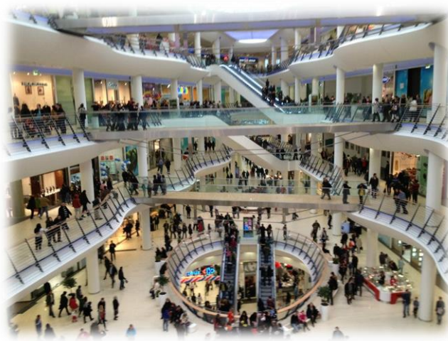
Fig. 1- Personas en centro comercial

Mediante un análisis orientado a la identificación y clasificación de los riesgos y amenazas estos sectores económicos determinan los Planes de Emergencia Internos y Externos (PEI, PEE) cuyos manuales contienen toda la información necesaria para el control de cada tipo de emergencia dentro de la instalación pública y zonas comerciales que puedan verse afectadas.